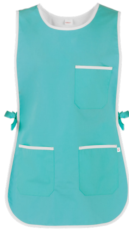
M19 Verde acqua