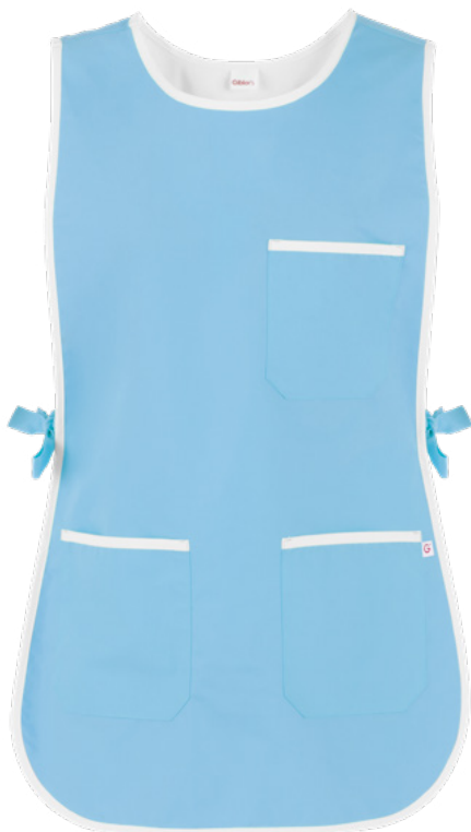
C08 Azzurro chiaro